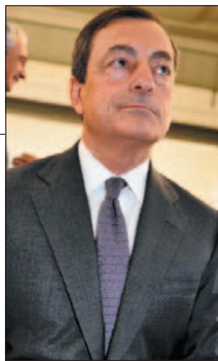
Mario Draghi, protagonista di un piccolo incidente sportivo