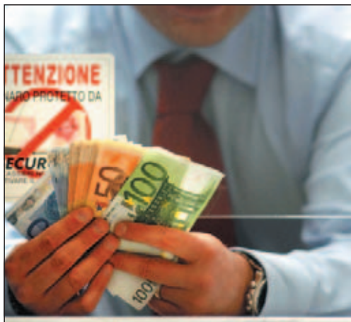
Uno sportello bancario: un collegio regolerà le liti

L'Italia toccherà, nel 2010, un debito mai raggiunto prima nella zona euro, pari al 116%. La situazione ha spinto l'Ue a richiamare il governo, dichiarando «indispensabile che l'Italia proceda ad una rapida azione di risanamento per garantire una stabile riduzione del suo insostenibile debito». Fiducioso il ministro dell'Economia, Giulio Tremonti, che ha affermato: «L'Italia è in una fascia di rischio medio».